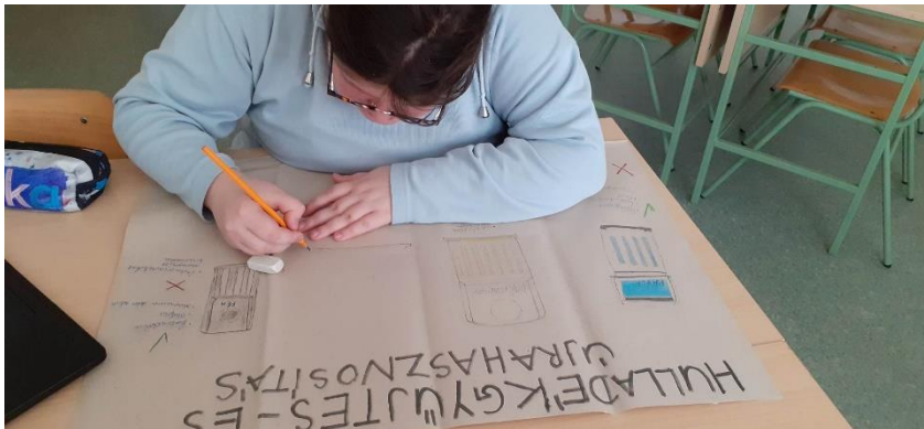
SNI tanulók munkája